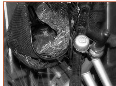
Rede i cykelkurv