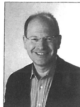
Af Peter Thyssen