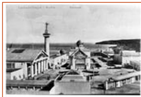
Vue ud over arealet tæt på Tangkrogen, hvor udstillingen fandt sted. Postkortfoto.

I perioden 16. maj til 30. september udstillede ikke bare byens, men hele Danmarks førende erhvervsvirksomheder i Århus, deres produkter blev præmieret efter klasser på udstillingen. På udstillingen kunne man også se en dansk stationsby anno 1909 med station, skole og huse m.v. tegnet af landets førende arkitekter. Der var udstillinger om Færøerne og Island og den 4. juli