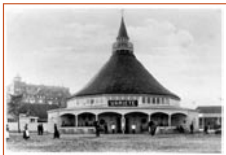
Varietéen på Landsudstillingen med Skansepalæet i baggrunden. Postkortfoto.

Ideen til en Landsudstilling i Århus opstod i kølvandet på den industrialisering, som tog sin begyndelse i midten af 1800'årene. På godt halvtreds år voksede Århus fra ca. 7000 indbyggere i 1850 til over 60.000 i begyndelsen af 1900'årene. Byen fik en moderne kysthavn, blev jernbaneknudepunkt i Jylland og i kølvandet herpå opstod en række større indu-