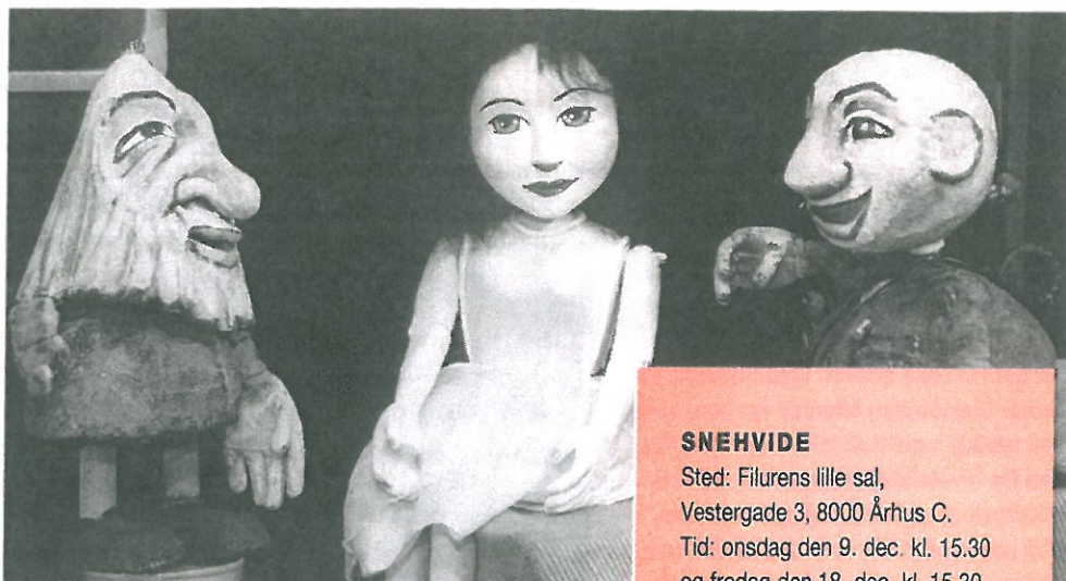
Den skønne Snehvide med to af dværgene i Filurens opsætning af det gamle eventyr.

billige billetter til to forestillinger i december. Prisen er kun 30 kr. for børn og 40 kr. for voksne. Vi har kun et begrænset antal billetter, så du skal være hurtig. Billetsalget starter den 6. november fra kursusbutikken.