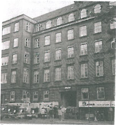
Park Alle 7