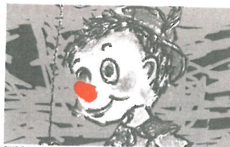
PINOCCHIO TEGNET AF SUS HAUGLAND

Pinocchio bærer tydeligt præg af at komme fra Italien. Bogens humor har meget til