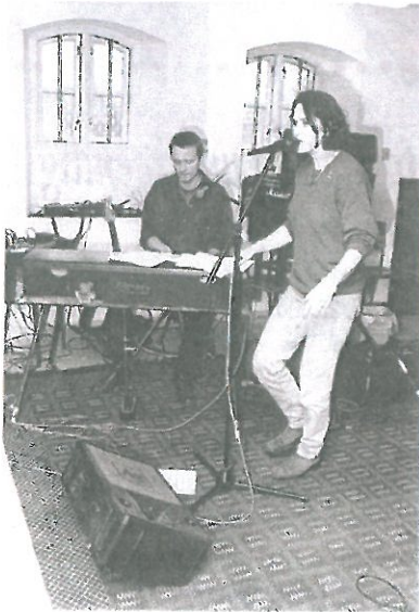
Indøvnning af musik til en af Opgang 2's forestillinger

at løbe forvaltninger og ministerier på dørene for at få lov til at lave et tilbud til de unge, der mere eller mindre var opgivet og overladt til sig selv. Projektet har haft mange navne og forskellige adresser efterhånden, som der blev