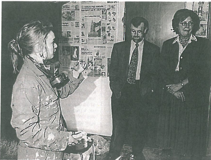
Udsmykning af Opgang 2's nye teaterfoyer.

Folkeoplysningsloven drejer sig om støtte til frivillig voksenuddannelse som f.eks. aftenskolen, men en vigtig del af loven handler om støtte til det, der kaldes specialundervisning og hensyntagende undervisning , dvs. undervisning til mennesker, som af en eller anden grund har svært ved at få noget ud af almindelig skolegang. Man taler om, at det er mennesker med indlæringsvanskeligheder . Det er bare et dårligt ord, for det er bestemt ikke sikkert, at de har svært ved at lære det samme, som andre, men de kan have svært ved at gøre det på den samme måde eller i samme tempo.