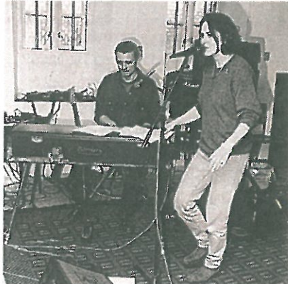
Indøvning af musik til Opgang 2's næste forestilling.

Forestillingen, koncerten, bogen, videoen er bevis på, at man har lært en masse praktiske ting, at man har lært at arbejde sammen, at man kan lægge planer og gennemføre dem. Deltagerne er fyldt med erfaringer og ny viden om sig selv og deres omgivelser. Og efter 10 måneder i Opgang 2 har de unge planer med sig selv og går videre med nogle af de ting, de nu ved, de kan.