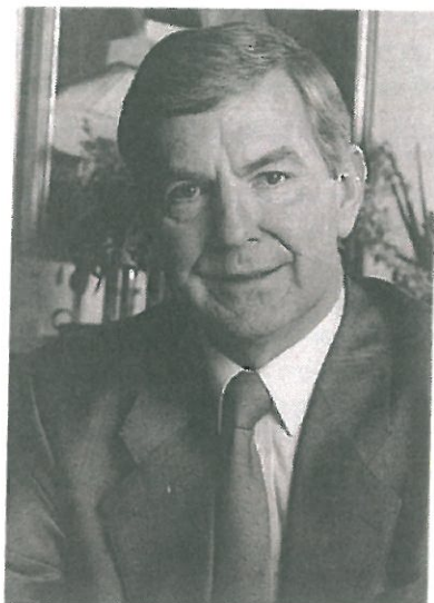
Af undervisningsminister Ole Vig Jensen

Næsten alle kender fornemmelsen af at stå i stemmeboksen og sætte kryds på stemmesedlen. Vi er bekendt med følelsen af at være med til at træffe de vigtige beslutninger.