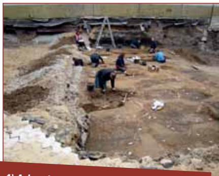
4) Arkæologerne fra Moesgaard rykkede ind