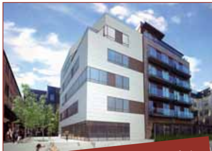
6) ... og sådan kommer det nye hus til at se ud når det er færdigt næste sommer