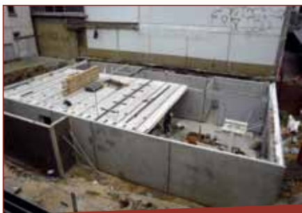
5) å blev der støbt fundament og anlagt kælder