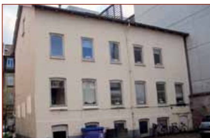
1) Sådan så Frederiksgade 78B ud da alt stadig var ved det gamle