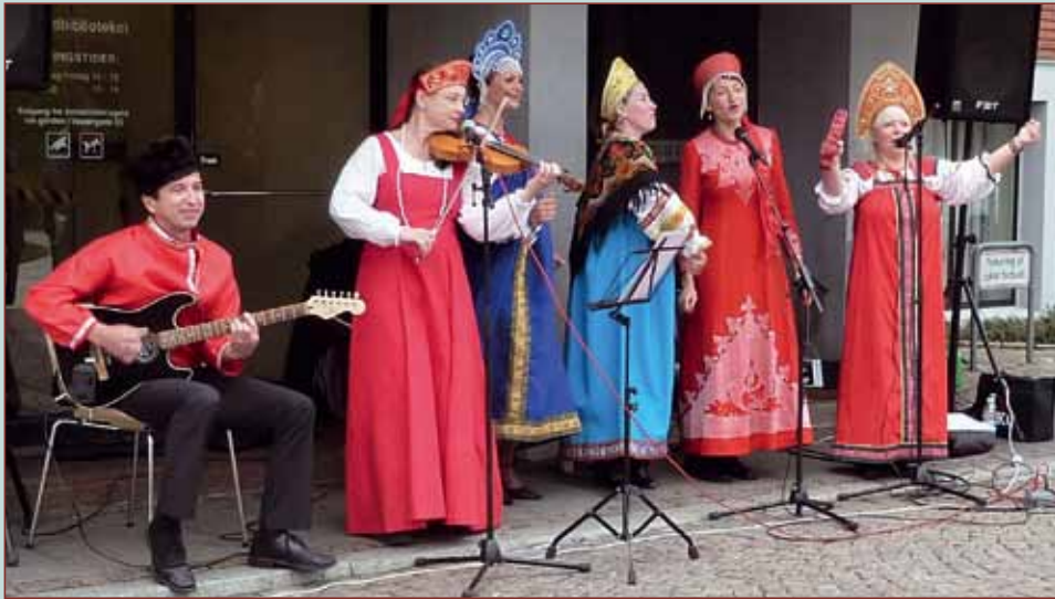
Det russiske kor Kalinka var et af flere musikalske indslag i Mølleparken