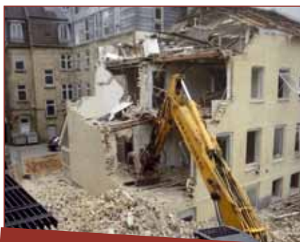
2) Så begyndte nedrivningen